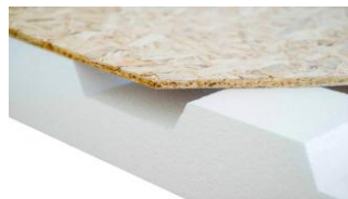
AIR TOP B120

AIR TOP B120 è un sistema isolante in Polistirene Espanso Sinterizzato autoestinguento idoneo per l'isolamento su coperture a falda.